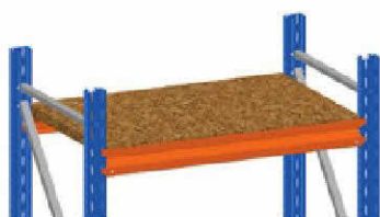
Surowa płyta wiórowa