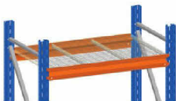
Pianele siatkowe zamocowane na klipsy lub na belkach.